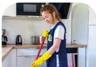
ENTRETIEN DU DOMICILE ET DU LINGE