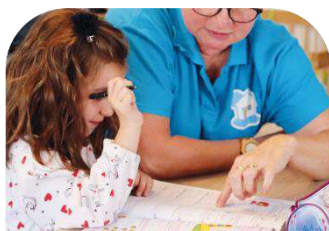
GARDE D'ENFANTS À DOMICILE