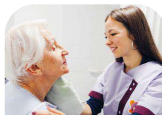
AIDE À DOMICILE